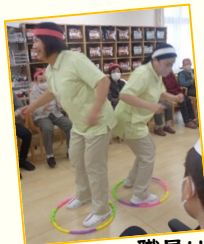
職員は尻相撲・綱引き