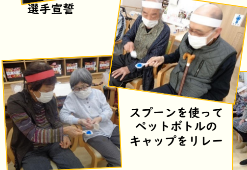
スプーンを使ってペットボトルのキャップをリレー