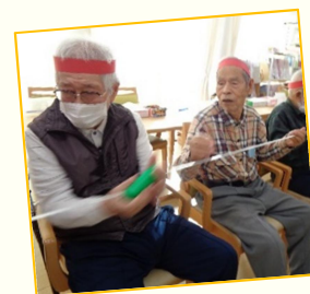
紐に通した筒をお隣りへ