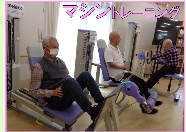
マシントレーニング