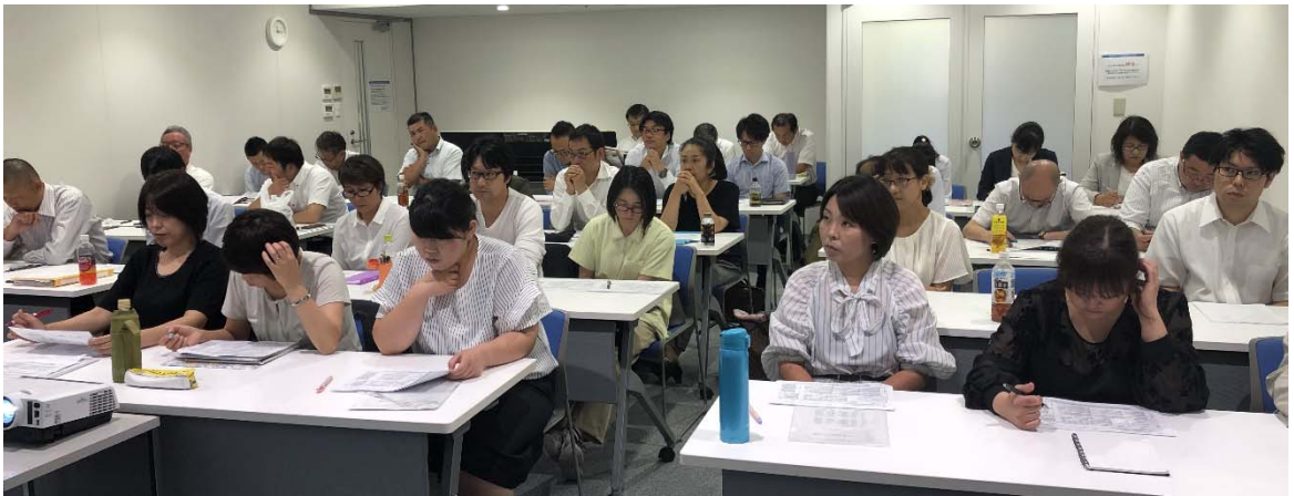
マネジメント研修会の様子